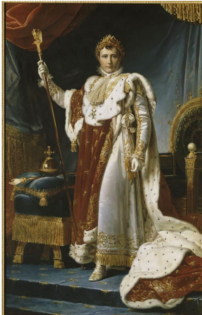
Napoléon Ier, empereur des Français , François Gérard, huile sur toile, 1805, 225,5 x 145,5 cm, MV5321