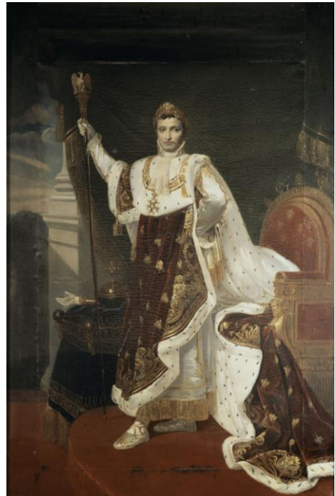
Napoléon Ier, empereur des Français, - Robert Lefèvre, huile sur toile, 1801-1900, 2,77m x 1,84m, Versailles, châteaux de Versailles et de Trianon

Sous le pinceau de Gérard, il est représenté en pied et de trois quarts de manière à présenter la plus grande partie de sa personne. Le portrait reste fidèle à l'esthétique et aux critères instaurés par Louis XIV en 1701 à travers son portrait de Rigaud et marque une continuité dans la représentation de l'exercice et de la symbolique du pouvoir. Gérard propose le parfait équilibre entre l'aspect solennel et humain de l'Empereur. C'est pour cette raison que Napoléon choisit l'artiste pour son portrait officiel en le diffusant abondamment dans les premières années du régime.